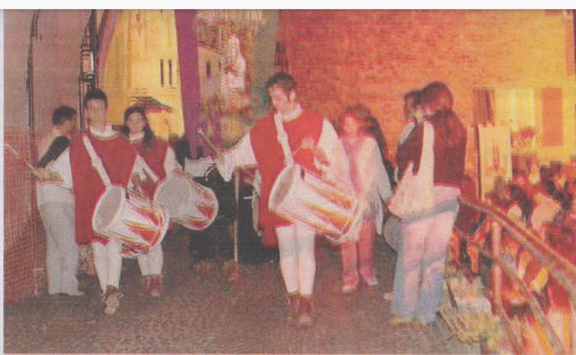
Musici, mangiafuoco e giocolieri: questa sera l'ultimo appuntamento con Templaria

PROSEGUE , a Villa San Pio X di Spinetoli, l'edizione 2011 della tradizionale «Festa Fiobbo», organizzata dall'amministrazione comunale in collaborazione con il circolo ricreativo del paese. Ogni sera, fino a domenica, saranno attivi moltissimi stand gastronomici e sarà possibile assaggiare delle ottime specialità, dalle olive fritte all'ascolana alla pecora in callara, passando per le pennette, i saltimbocca e le mezze maniche. Il programma relativo alle iniziative previste per l'occasione è molto ricco. Questa sera, alle 20.30, si svolgerà la gara di briscola, cui farà seguito lo spettacolo del gruppo «La Martinicchia». Domani, invece, si esibiranno i «Tropicana», mentre domenica Max Gazzè.